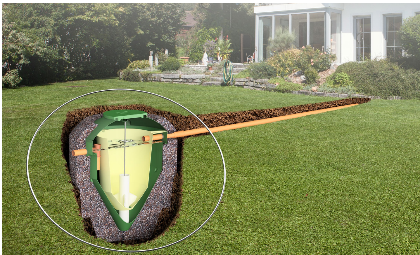
Illustration non à l'échelle

Notre expertise de haut niveau est le gage que nous offrons à tous nos clients, du propriétaire particulier aux grandes municipalités, d'un équipement solide et respectueux des normes de protection de l'environnement.